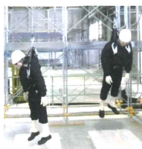
フルハーネス型墜落制止用器具 につられる危険体感教育