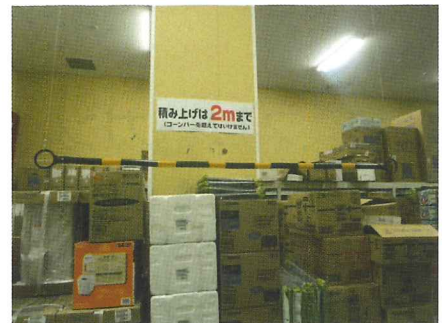
バーをつり下げ、 積み上げ高さを制限