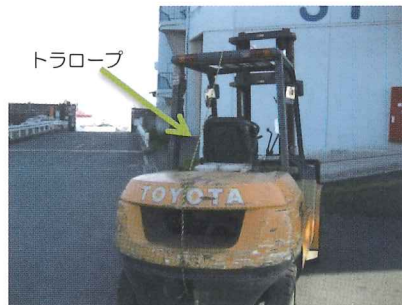
トラロープが見えるまで 振り返り、後方確認