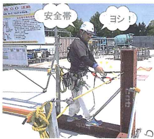
試行ゲートで点検と訓練