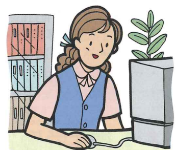
eラーニングも有効