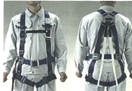
フルハーネス型安全帯